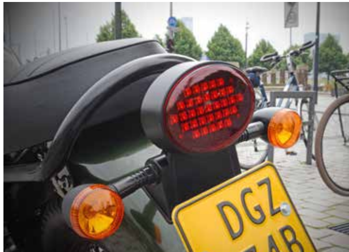
Het LED achterlicht maakt hem weer van deze tijd

voorkork of achterveer uit, iets wat de nodige indruk heeft gemaakt. Door de steile hoek waarin de voorkork zit gemonteerd worden stuurcommando's vlot opgevolgd. Het hele stuurkarakter staat op een hoog niveau, iets wat ook debet is aan de gekozen grote wielen en de relatief smalle banden. Een enkele remschijf in het voorwiel en een trommelrem aan de achterzijde moeten de RAW50 uiteindelijk snel doen vertragen. De Hanway loopt niet over van de pure rempower maar een voldoende scoort hij zeker. Beide remmen zijn licht in gebruik en gemakkelijk te bedienen, een blokkerend wiel blijft dan ook lang uit.