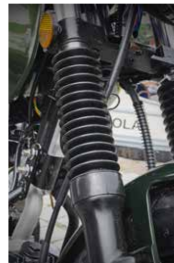
Door de geplaatste rubbers maakt steenslag en daarmee lekkage geen kans

soepel afgestelde achterveer, precies zoals het hoort. Tijdens de test zag ik een verkeersdrempel net even over het hoofd waardoor ik er ook veel te hard overheen 'vloog'. Tot mijn verbazing bleef een doorslaande