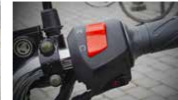
Starten doe je elektrisch...