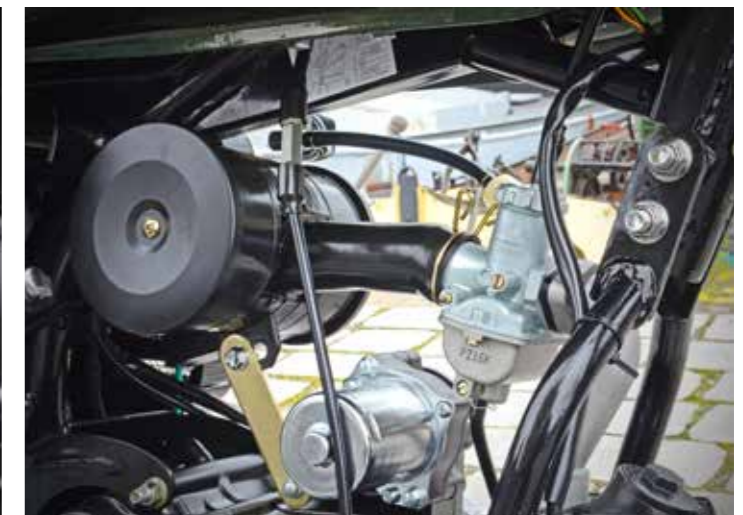
Nee geen injectie, een 16mm carburateur geleidt het mengsel richting de cilinder