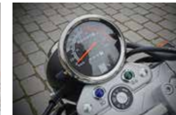
Een duidelijke analoge snelheidsmeter inclusief een versnellingsindicator