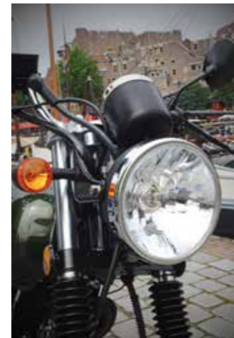
Klassieke blik vanuit een helder glaasje

Hanway betreedt met de RAW50 het segment van de 50cc café-racers. Nostalgisch en back to basic en inclusief alle kenmerken die je van een klassieke bromfiets zal verwachten. We deden ons 'potje' op en maakten ons op voor een kennismaking met de nieuwe Hanway!