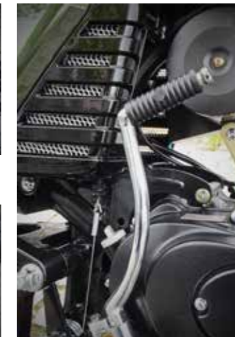
...of met de 'retro' kickstarter