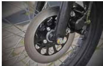
Koelsleuven ontbreken maar remmen doet de schijfrem prima