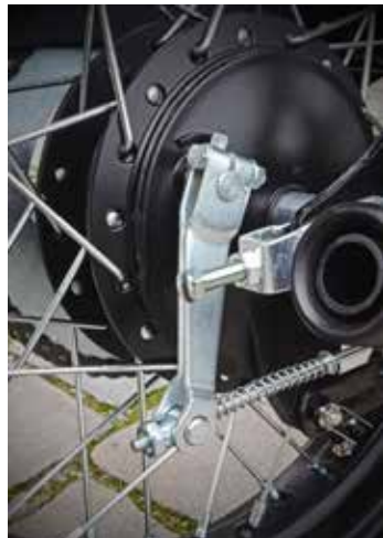
De trommelrem in het achterwiel assisteert met succes de schijfrem op het voorwiel