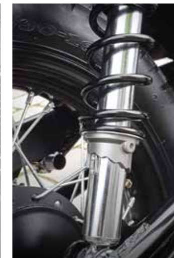
Instelbare veervoorspanning op de dubbele achterveren aan de achterzijde