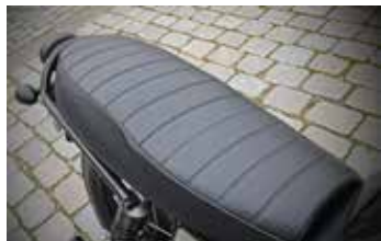
Fraai zadel en ruim genoeg voor twee!