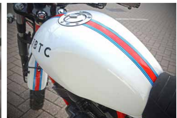
Aandachtspuntje, de tank verdient eigenlijk een mooier embleem dan deze sticker