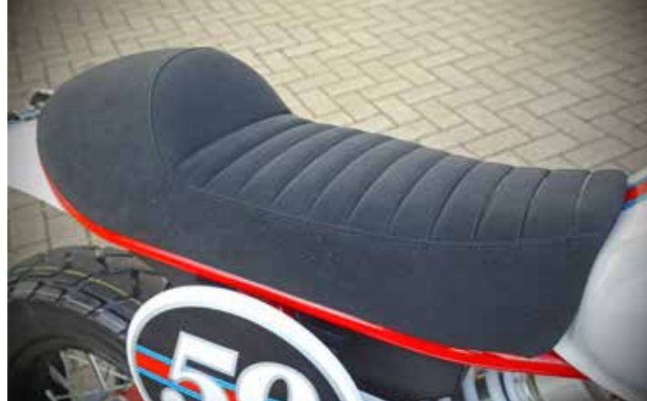
Niet alleen fraai materiaal maar hij zit ook nog eens fijn