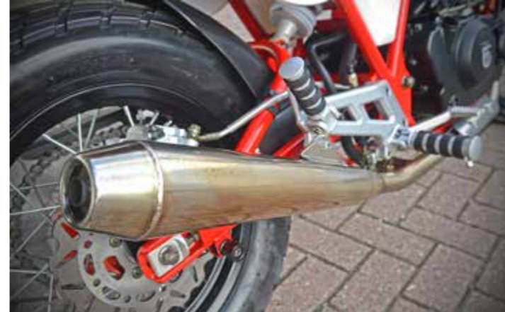
Fraai twee in één uitlaatsysteem en goed voor een lekkere sound