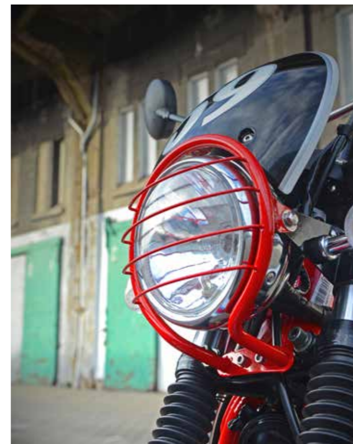
Op de Martini uitvoering zit standaard een koplamprooster

Als motorfietsmerk kan je er tegenwoordig niet meer omheen en je moet er minimaal één in je assortiment hebben. We hebben het dan over een Café Racer of een Scrambler. Dé trend van het afgelopen jaar maar dat die dit jaar doorzet en nog wel even blijft is denk ik wel een feit. Beleving en motorrijden horen tegenwoordig weer echt bij elkaar en daar passen deze types motorfietsen precies in. Back to basics, minder cc's maar ook de uitrusting en accessoires spelen een grote rol in deze scene. Voor degene die nog niet weten waar de kreten vandaan komen. Bij een Café Racer gaat het meestal om een tot sportmodel omgebouwde standaard motor. De veelal saaiere Europese motorfietsen uit de jaren '50 en '60 werden voorzien van clip-ons of M-stuurttjes, een zadelscombinatie die puur geschikt was voor één persoon, kortere spatborden en uiteraard een ander uitlaatsysteem zodat hij ook sportiever zou klinken. Een ander model dat we tegenwoordig veel zien is de Scrambler. Een typeaanduiding die niet alleen gerelateerd is aan de Ducati maar die in de jaren zestig werd gebruikt door veel fabrikanten. Het is simpelweg een standaard motorfiets die gebruikt werd buiten de geasfalteerde paden. Zo had de motorfiets iets meer bodemvrijheid door hogere vering, waren de banden voorzien van noppen en liep de uitlaat hoog om zo geen beschadigingen te krijgen door stenen en andere obstakels. De uitlaat was