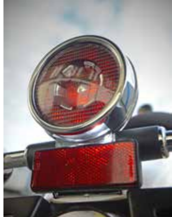
Hoe mooi kan iets simpels als een achterlicht zijn