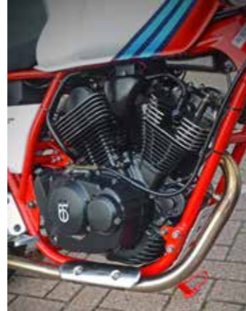
Een V-twin is het kloppende hart in de BTC