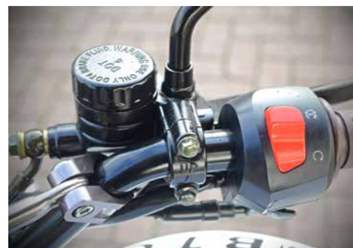
Het remvoestof reservoir is een keer met een schroefdeksel uitgevoerd