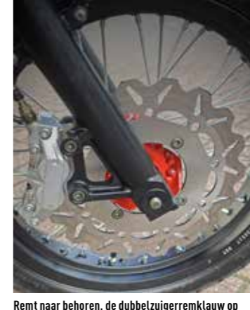
Remt naar behoren, de dubbelzuigerremklauw op de 'wave' schijf